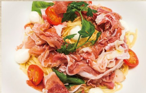
生ハム モッツアレラチーズと バジルのスパゲティ