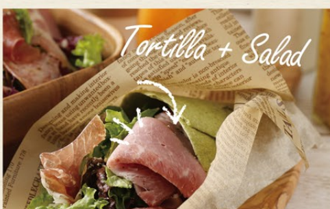
Tortilla + Salad