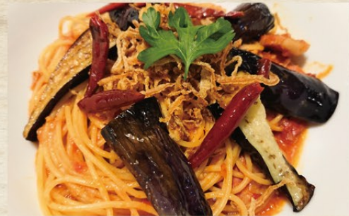
厚切りベーコンとナスの アラビアータスパゲティーニ