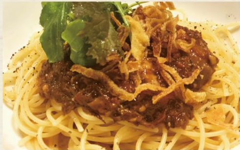
牛すね肉の赤ワイン煮込み きのこのパスタ