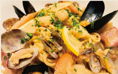
魚介たっぷり ベスカトーレピアンコ