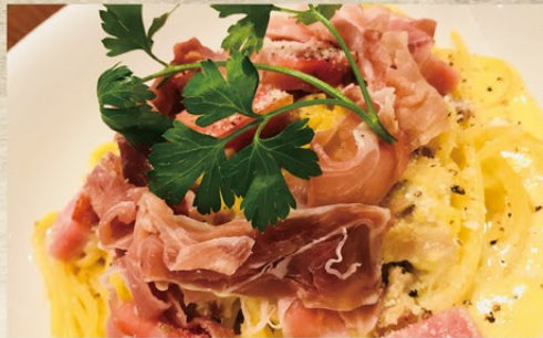
厚切りベーコンを使用した チーズと黒胡椒の香る スパゲティーカルボナーラ