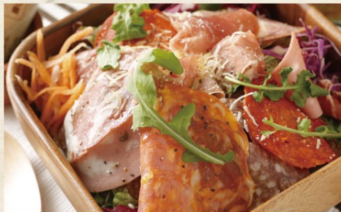
サンタモニカシャルキュトリー メガ盛りサラダ (トルティーヤ付)